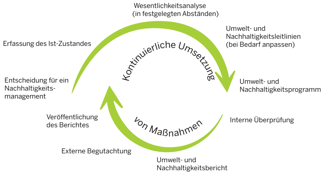
Abbildung 2: Schritte des kontinuierlichen Verbesserungsprozesses