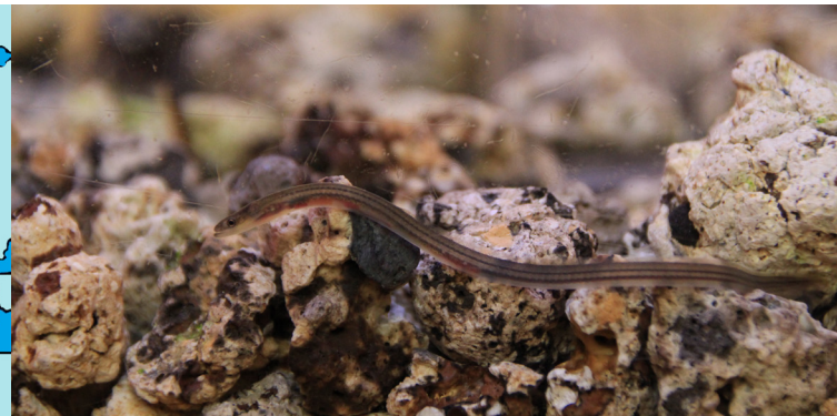
Dieser Aal befindet sich im Übergang vom Glasaal zum Steigaal

Der Lebenszyklus des Europäischen Aales ist komplex – deshalb gibt es auch potenziell viele Gründe für den Rückgang seines Bestandes. Wehre und Wasserkraftanlagen hindern die Aale daran, die Flüsse hochzuwandern, Turbinen töten die Fische bei der Abwanderung. Umweltgifte reichern sich im fettreichen Fischgewebe an, eingeschleppte Parasiten und Krankheiten schwächen oder töten die Tiere. Durch den Klimawandel ändern sich die Bedingungen im Meer. Zudem können die fischereilichen Entnahmen und natürliche Feinde den Aalbestand negativ beeinflussen.