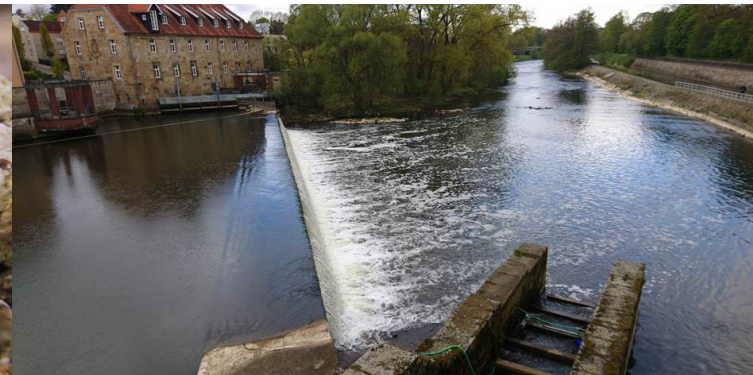
Wehre können Wanderhindernisse für den Aal sein