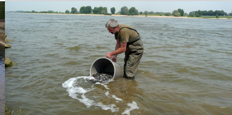
Ein Fischereikologe entlässt Jungaale in die Freiheit

Im Rahmen dieses Projektes führt das LANUV jährlich Aal-Besatzmaßnahmen durch und begleitet sie wissenschaftlich. Mittels spezieller Monitoringverfahren, die umseitig näher beschrieben sind, überwachen und optimieren die Fischereikologen die Maßnahmen. Das langfristige Ziel ist es, analog zur EU-Aalverordnung, die menschengemachte Sterblichkeit so zu verringern, dass mindestens 40 Prozent der Blankaalbiomasse, gemessen an einem Referenzbestand ohne menschliche Einflüsse, aus den Flüssen Richtung Sargassosee abwandern.