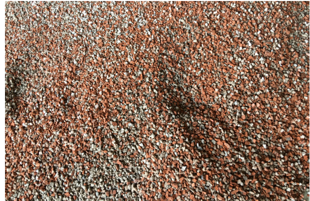
Gesteinskörnung Typ 2

Typ 1 besteht überwiegend aus gebrochenem Beton, während Typ 2 auch Mauerwerksbruch, also zum Beispiel Ziegel oder Kalksandstein, bis zu einem Anteil von 30 Prozent enthalten darf. Die Umweltverträglichkeit wird durch die ebenfalls in DIN 4226-101 geregelten Höchstwerte für organische und anorganische Parameter gewährleistet.