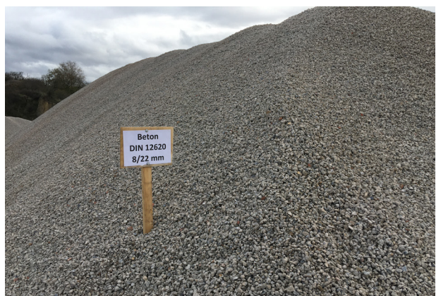
Selektiver Rückbau ist die Basis für hochwertiges Recycling