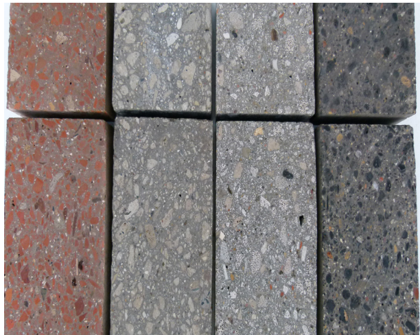
Beton mit rezyklierter Gesteinskörnung, angeschliffen

Auch in der modernen Architektur ist der Einsatz von Beton mit rezyklierter Gesteinskörnung attraktiv: Gerade bei Sichtbeton kann der farbige Mauerwerksbruch interessante optische Akzente setzen.