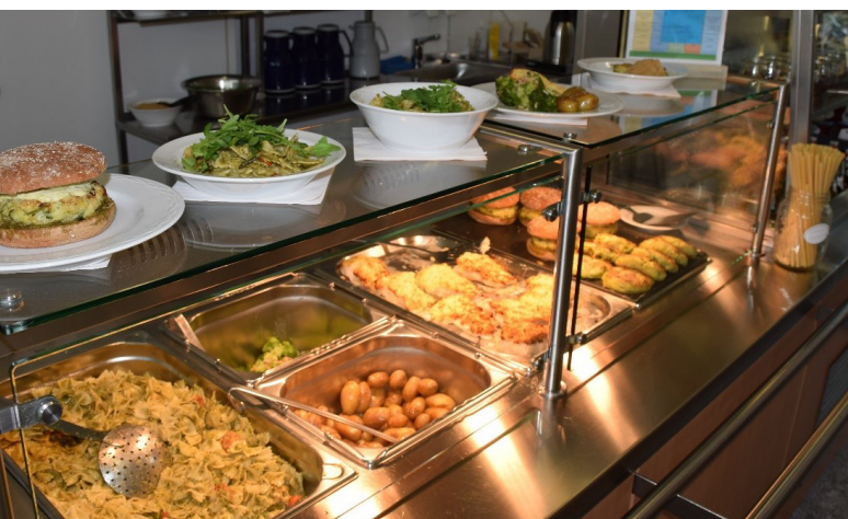
Variable Portionsgrößen aus vorhandenen Geschirr