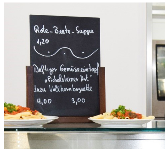
Die zweite Portionsgröße auf einem Kuchenteller serviert

Eine im Jahr 2017 im LANUV durchgeführte Umfrage (n=373) hat ergeben, dass sich die Gäste des Betriebsrestaurants zwei verschiedene Portionsgrößen wünschen. Dies wurde somit in den Leistungsbeschreibungen der Ausschreibungen zur Kantinenpächtersuche für die LANUV Standorte Essen und Duisburg Anfang 2019 berücksichtigt. Bei bestehenden Verträgen kann, in Rücksprache mit dem Pächter, über einen „Testzeitraum“ die Einführung von zwei Portionsgrößen besprochen werden.